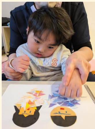
お宝探し中何が出るかな？