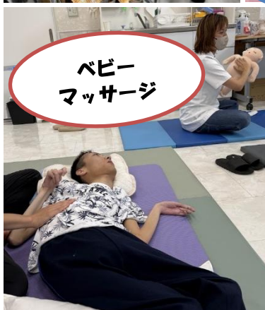
ベビー マッサージ