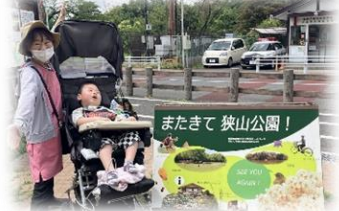
狭山公園へお出かけ