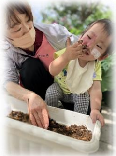
ふうせんかずら種まきと手作りリースプレゼント