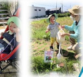
狭山湖お出かけ、じゃがいも堀り、朝顔水やり