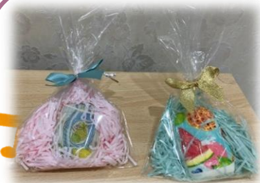
せっけんのデコパージュ 夏休みの製作で 予定しています