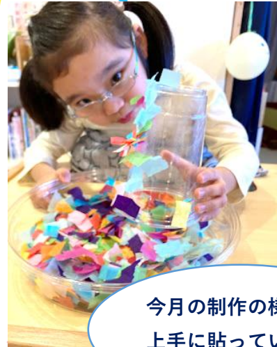
今月の制作の様子 上手に貼っています