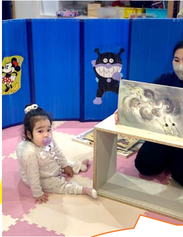
紙芝居を聞いています