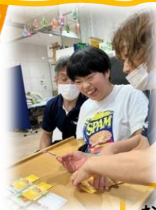
お料理カードゲーム