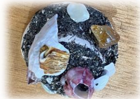
夏の思い出 貝がらマグネット