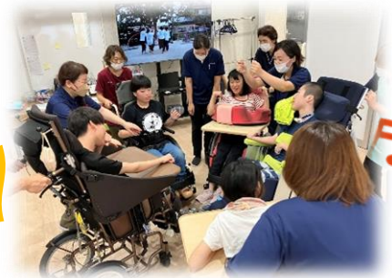
みんな大好き フォークダンス