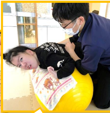
リハビリ、 がんばってます！