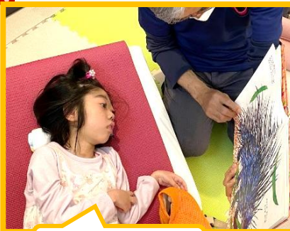
絵本に集中・・・